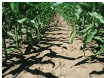
Tolna megye (Dalmand) 2013