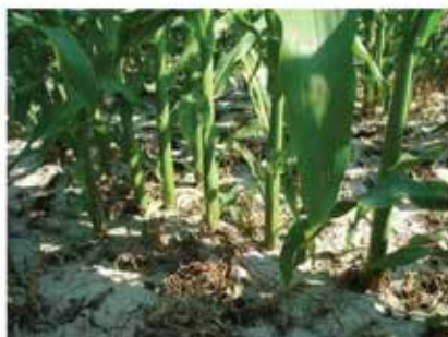
Győr-Moson-Sopron megye (Dunakiliti) 2014