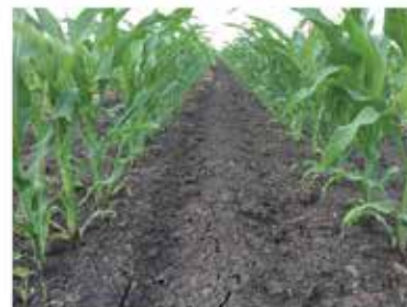
Szabolcs-Szatmár-Bereg (Tiszadob) 2017