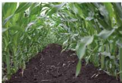
Hajdú-Bihar megye (Balmazújváros) 2017