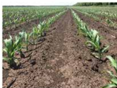
Szabolcs-Szatmár-Bereg (Tiszaeszlár) 2017