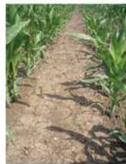
Jász-Nagykun-Szolnok megye (Tiszabő) 2017