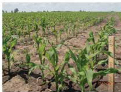
Békés-megye (Mezőhegyes) 2013