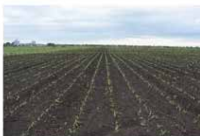
Hajdú-Bihar megye (Földes) 2017