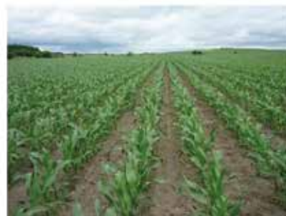
Somogy-megye (Siófok) 2013