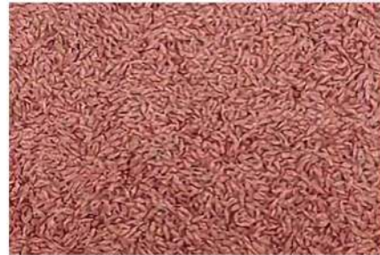
A Biosild Extra színezőképessége őszi búzán és őszi árpán. (Eurofins 2021.)