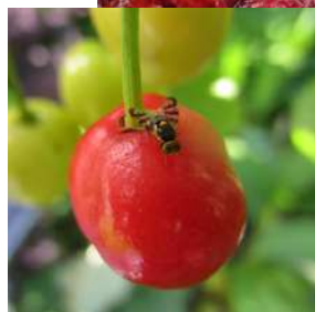
Nyugati dióburok fúrólégy és lárvája