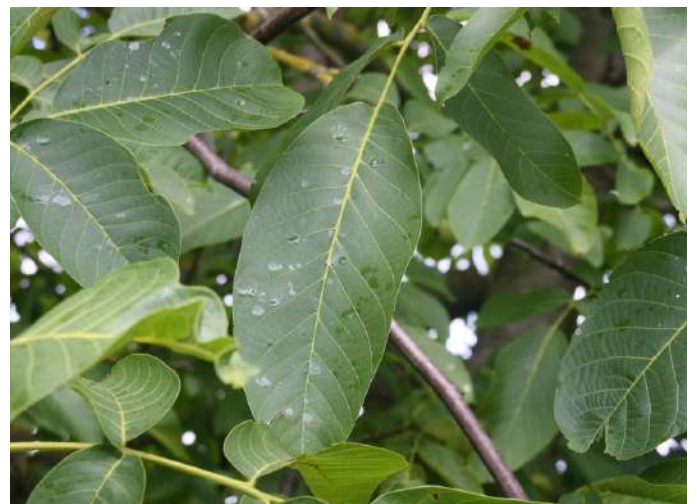
A csali technológia 2-3 mm átmérőjű nagy cseppeket igényel.

Ha a szomszédban (25-30 méteren belül) kezeletlen fa van, akkor a védekezés hatékonysága csökkenhet, mivel az onnan érkező, tojásrakó egyedek már nem táplálkoznak.